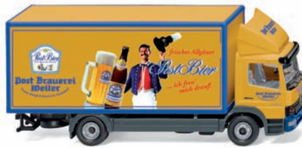
0435 05 Koffer-Lkw (MB Atego) UVP 18,99 €