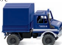
0693 16 THW - Unimog U 1700 mit Plane UVP 9,99 €