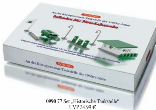
0990 77 Set „Historische Tankstelle“ UVP 34,99 €

Liebe zu Raritäten wird belohnt: Mit einem Klassiker-Set aus historischen Formen lässt WIKING die 1950er-Jahre lebendig werden, als die heute längst vergessene Treibstoffmarke „Rheinpreussen“ vor allem im Ruhr-Revier zum Straßenbild gehörte. Opel Blitz-Tankwagen, aber auch die typisch grün-weißen Zapfsäulen und das legendäre „Haus zur Tankstelle“ finden damit den Weg in Liebhaberhände. Ölfässer, Bogenlampe und Verkehrsinsel hält das Set ebenfalls bereit – die authentische WIKING-Ausstattung für eine zeitgenössische Szenerie. Außer-