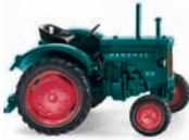
0885 04 Hanomag R16 UVP 11,99 €