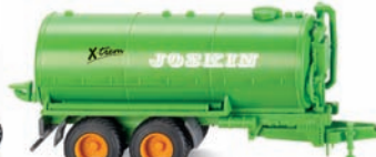
0382 39 Vakuumfasswagen (Joskin) UVP 11,99 €