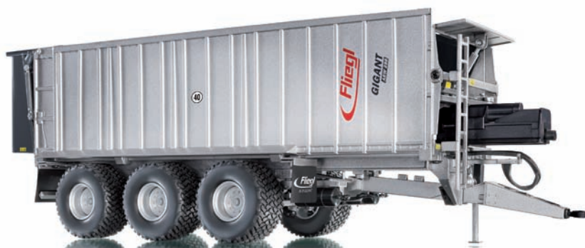
0773 13 Fliegl Abschiebewagen ASW288 UVP 59,95 €