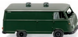
0270 48 Borgward Kastenwagen B611 UVP 12,49 €