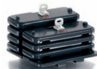
0773 80 Ballastgewichte für Claas Xerion UVP 14,95 €