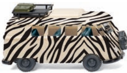
0797 09 VW T1 Campingbus „Safari“ UVP 14,99 €