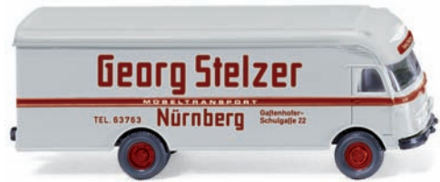
0500 01 Möbelwagen (Ackermann) UVP 12,99 €